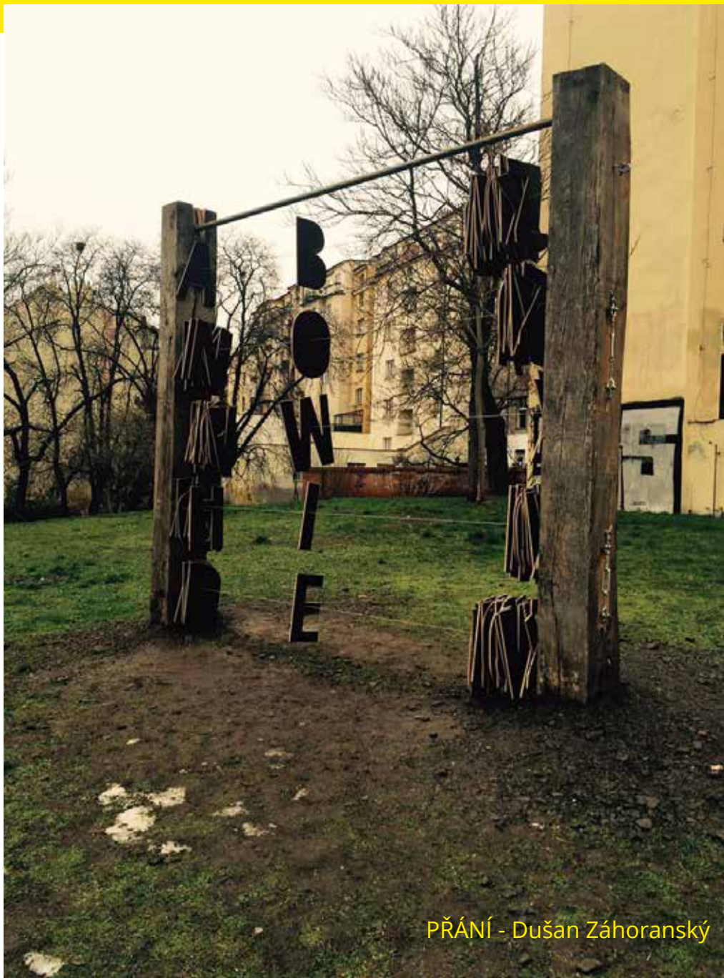
PŘÁNÍ - Dušan Záhoranský